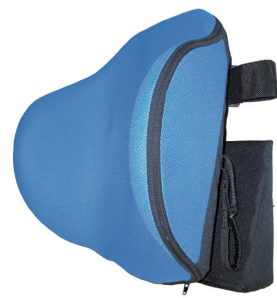
バックサポートディープ