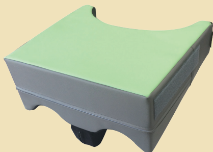
腕まくらプラス 税抜 10,000 円

置くだけ簡単！前方の支持面積が広がり、姿勢が安定します。荷重も分散される事により、座圧も軽減されます。